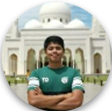
Muz Bin Mohd Nasir Operation Assistan (GURU) Adzan Quranic Center