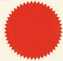
KETUA BODI UNITI EKSEKUTIF

PENGANGGAPAN PERAKUAN AKREDITASI INI ADALAH TERTAKLUK KEPADA PERATURAN-PERATURAN DAN SYARAT-SYARAT YANG TELAH DITETAPKAN OLEH AGENSI